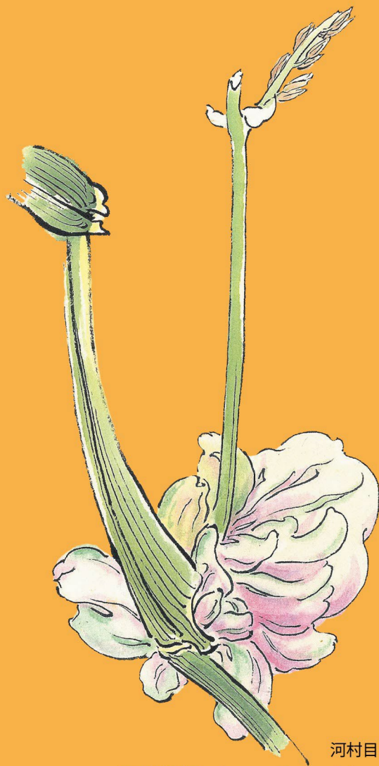
河村目呂二 『閉停籠独誌 (ヘテロドックス) 上』より