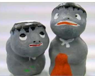
上の写真は「北条の土人形」の河童。